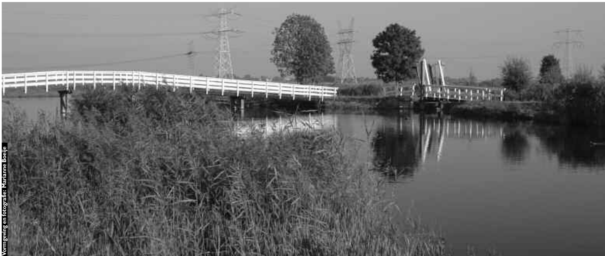
Vormgeving en fotografie: Marianne Boeije

Supplement op het reglement voor de afdelingen van de Bond van Volkstuinders te Amsterdam