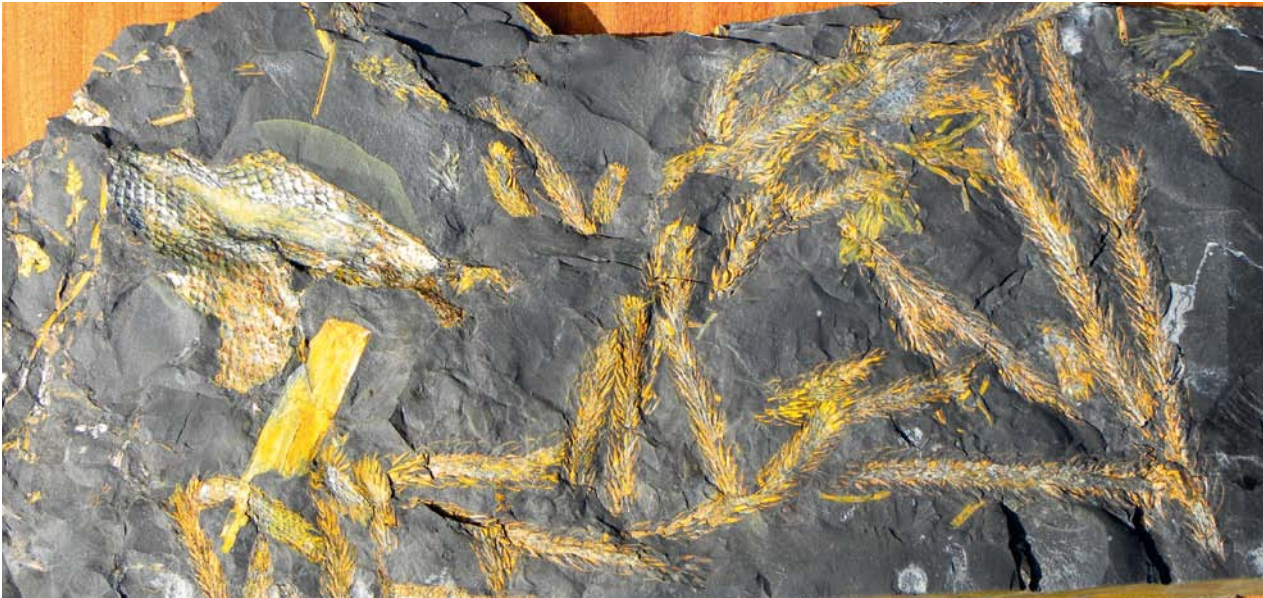
AFBEELDING 4. | Lepidodendron lycopodioides : twijgen van de wolfsklauwboom Lepidodendron . Links een stuk van een dikke tak. Breedte van de foto 45 cm.

hebben (Afb. 4). Het was waarschijnlijk te veel van het goede voor hem. Ik moet erg verheugd gekeken hebben, hoewel ik besepte dat ik nog een lange tocht met een zware rugzak en deze acht kilo wegende baby in mijn armen voor de boeg had. Maar het was de moeite waard: wolfsklauwtwijgjes zijn zeer algemeen, maar zoveel bij elkaar en zo mooi getekend, is wel bijzonder. Boomvormige wolfsklauwen zijn, zoals bekend, uitgestorven. Vermeldenswaard is dat de boom als geheel de genusnaam Lepidodendron draagt, maar dat deze naam ook gebruikt wordt voor de onderdelen zoals de bast, de takken en de twijgen. Zo worden de twijgen van afbeelding 4 Lepidodendron lycopodioides genoemd.