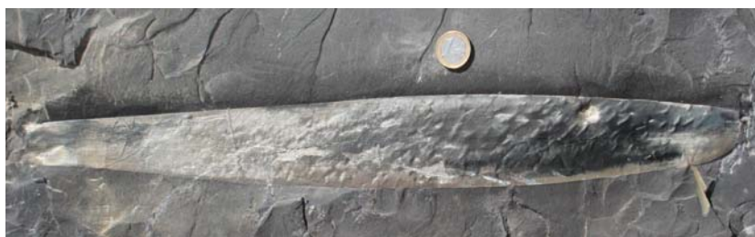
AFBEELDING 3. | Compleet blad van Cordaites . Lengte van het blad: 48 cm. Coll. André Mommers, foto: Xander Kaspers.

Toen wij aan het inpakken waren om weg te gaan, kwam de Duitse verzamelaar naar me toe met de vraag of ik het grote stuk met de wolfsklauwtakjes wilde