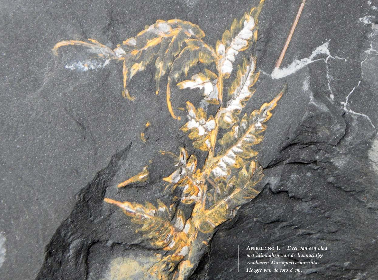
AFBEELDING 1. | Deel van een blad met klimhaken van de liaanachtige zaadvaren Mariopteris muricata . Hoogte van de foto 8 cm.