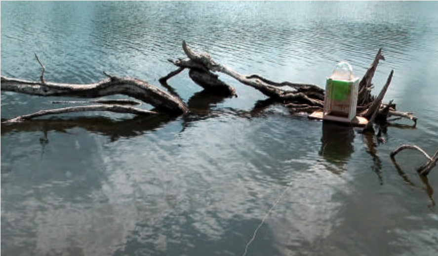
Drijvende Tempel nabij verdrinken bomen.

In tegenstelling met de geruchten die ons bereiken, wordt het TempelKundig Genootschap niet opgeheven, zo vertelde een woordvoerder ons. "Welnee, we hebben nog bergen en bergen onderzoek te verzetten, alleen de mobiliteit al, en aan het Hogere zijn we nog niet eens begonnen."