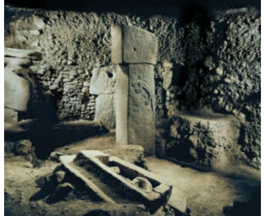
Megalieten in een van de 22 meter ronde tempels

Een Duitse archeoloog heeft de ontdekking van de oudste tempel ter wereld geclaimd. Het heet Gobekli Tepe en is in Turkije, ongeveer 10 kilometer van het stadje Urfa. Zeker twaalfduizend jaar oud, toen de prehistorische mens net bezig was over te gaan van jagen en verzamelen naar landbouw.