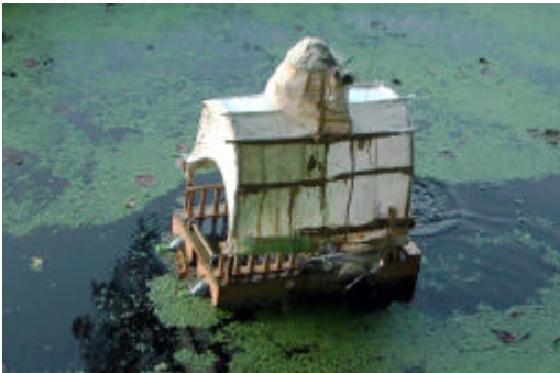
In het kroos verstrikt

De boot dreef stuurloos in het kroos. Door met een enterhaak aan een touw te gooien naar de boot slaagden we erin de boot te pakken te krijgen en naar de oever te trekken."