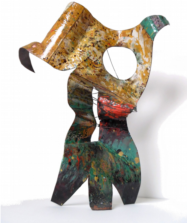
Saurus 2017 Open vlam emaille op koper 25x40x15 cm

Ze neemt me meer naar de tuin waar de gasbranders al klaarstaan op het rooster. Voordat de demonstratie begon was ik al langs de velen objecten in de tuin geleid die Bethje gemaakt heeft. In het vijvertje staat een grote opengewerkte bloem en daaromheen de werken waar het ijzer in verwerkt is.