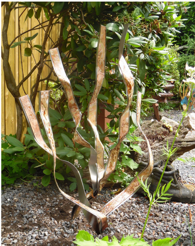
Zesprong 2016 Open vlam emaille op koper op ijzer. 60x90x50 cm