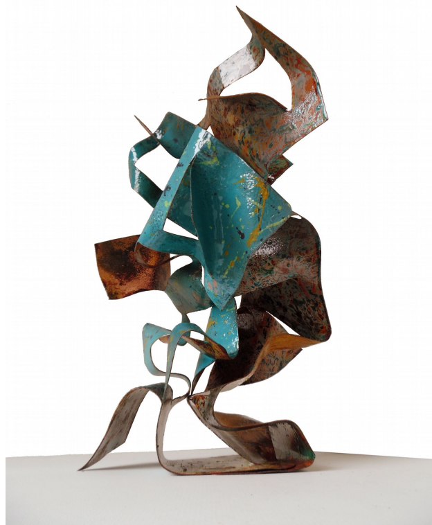
Omhelzing 2016 Open Vlam emaille op koper 25x50x35 cm