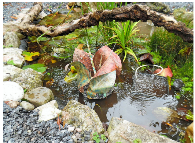
Waterplant 2017 Open vlam emaille op koper. 20X20x30 cm