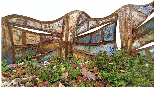
Waterslag 2019 open vlam emaille op koper op ijzeren casco Fragment 100x45 cm uit totaal van 290x200 cm

Haar emaillepoeders haalt ze bij Ton Hermes van Watermanshop. Ook bij hem kan ze altijd met vragen terecht en is er net als met Marij een goede vriendschap ontstaan.