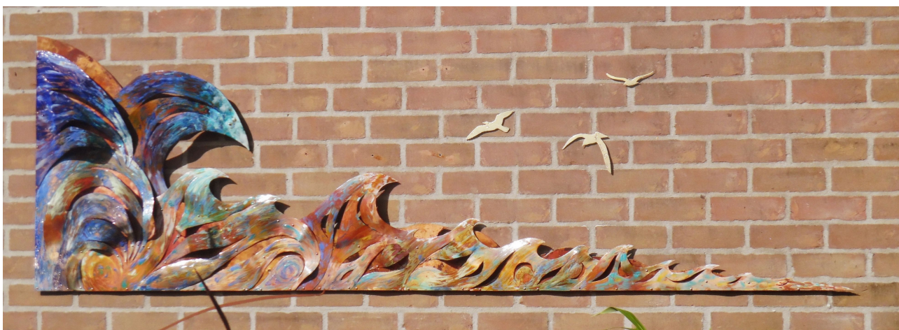
Branding 2019 open vlam emaille op koper 80x245 cm