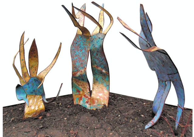
Les Papoteuses 2018 Open vlam emaille op koper op ijzeren casco 100x80x50 cm.

Aan de muur zie ik heel veel emailles en op tafel en in/op kasten grote en kleine 3d-emaille objecten. Eer ik met haar echt al het moois zou gaan bekijken, kreeg ik eerst koffie met een lekkere plak ontbijtkoek en vertelde ze mij hoe ze tot emailleren gekomen is.