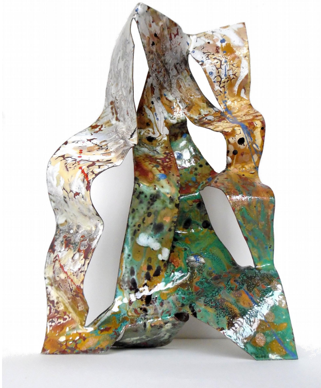
Babylon 2016 Open vlam 25x30 cm

Ze leidt me rond in haar atelier, een werkplaats met veel gereedschap en machines. Hieruit leid ik af dat haar werk veel meer behelst dan alleen het maken van het emailles. Ze koopt grote platen koper die gezaagd en geknipt worden. Daarnaast werkt ze met grote ijzerplaten.