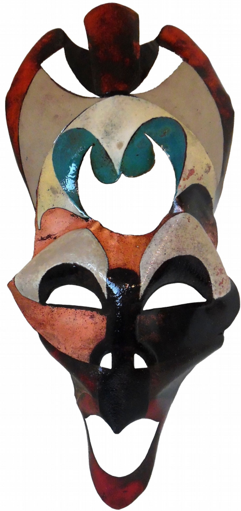
Prinses 2016 Open vlam emaille op koper 30x50x10 cm

Ze neemt me meer naar de tuin waar de gasbranders al klaarstaan op het rooster. Voordat de demonstratie begon was ik al langs de velen objecten in de tuin geleid die Bethje gemaakt heeft. In het vijvertje staat een grote opengewerkte bloem en daaromheen de werken waar het ijzer in verwerkt is.