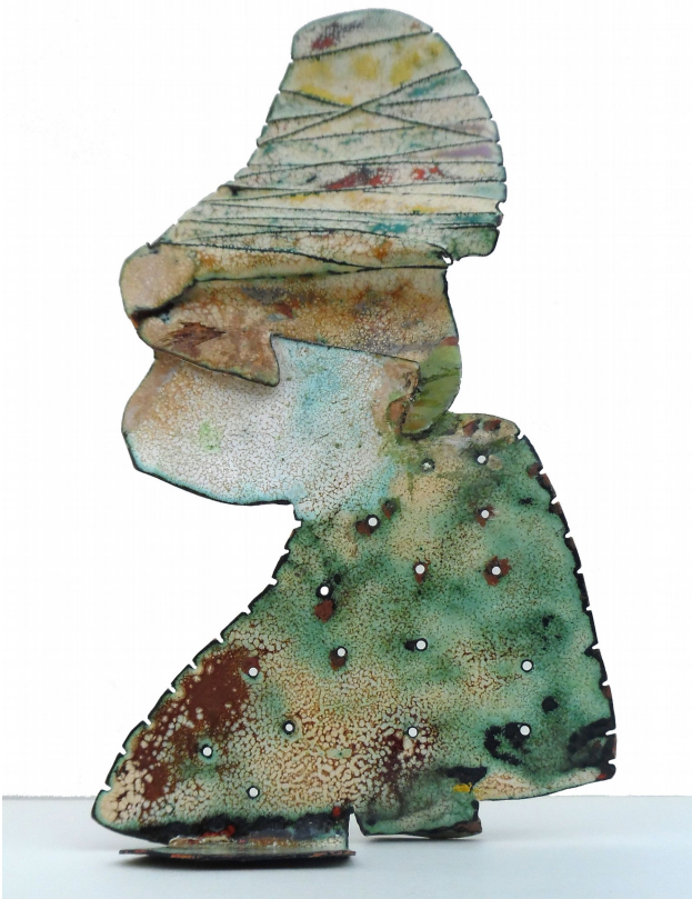
Monnik 2015 Emaille op koper – kleine oven in twee delen.

Tekst en interview: Elly Stembert Fotografie: Marc Marc Amsterdam