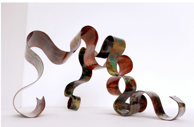
Kronkels 2016 open vlam op koper 40x25x15 cm