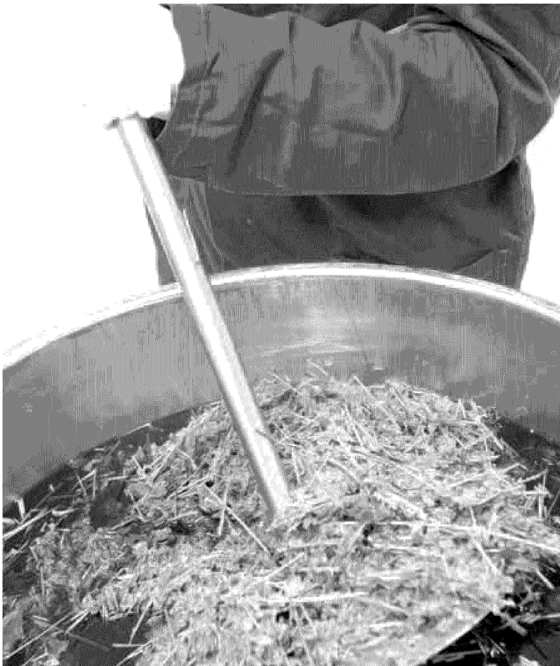
Productie van homeopathische middelen bij VSM in Alkmaar.