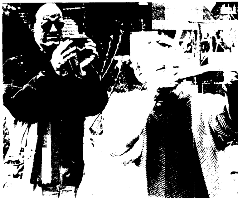
Figure 2. Metingen te Bergentheim. De kompasrichtingen worden bepaald, door over de waarnemer heen langs de lat te kijken met een (scheeps)kompas.

Uit de tabel met gegevens werd vervolgens een aantal posten met kleine residuen geselecteerd voor het bereke-