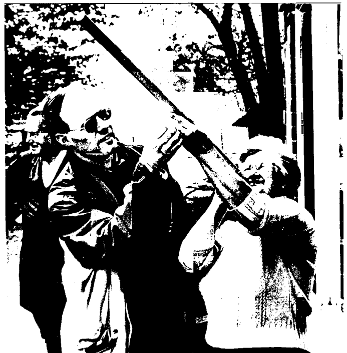
Figure 1: Metingen bij de familie Spiele te Hengelo. De hoogte wordt gemeten door de waarnemer langs een lat te laten kijken, waaraan een gradenboog met een schietlood is bevestigd.