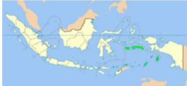
Het gebied dat geclaimd wordt door de RMS

Deze opstand werd hardhandig neergeslagen. Het maakte de integratie van enige duizenden Molukse voormalige KNIL-militairen in het Indonesische leger onmogelijk, omdat zij de RMS hadden ondersteund. Zij werden met hun gezinnen naar Nederland gebracht.