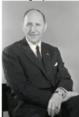
Mr. Joseph Luns

Het gouvernement op Nieuw Guinea begon ook meer met Australië en Australisch Nieuw Guinea samen te werken. Politici als minister-president Willem Drees en minister Joseph Luns, die in 1952 was aangetreden en verantwoordelijk was voor buitenlands beleid buiten Europa, uitten de mening, de een achteraf, de ander publiekelijk, dat de ideale staatkundige toekomst van Nederlands Nieuw Guinea een vereniging met Papoea-Nieuw Guinea was. Overigens was Nederland al met Indonesië overeengekomen dat de staatkundige positie van Nieuw Guinea slechts gewijzigd kon worden met instemming van Indonesië, dus een overdracht aan Australië behoorde alvast niet tot de mogelijkheden.