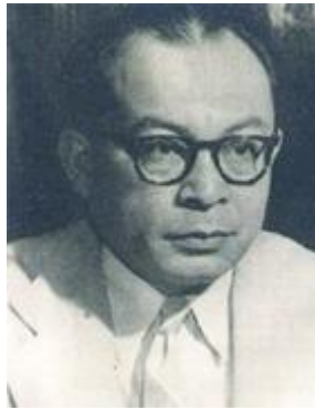
Dr. Mohammed Hatta

Uiteraard kon men van Indonesische zijde niet met deze eenzijdige aankleding akkoord gaan. De oppositie tegen dit plan werd nog het felst gevoerd door de federalisten; de Indonesische delegatie bestond namelijk uit de vertegenwoordigers van de Republiek Indonesia enerzijds en vertegenwoordigers uit federale staten anderzijds. Om de