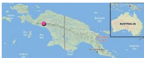
Het eiland Nieuw Guinea, met links Nederlands Nieuw Guinea

De Nederlandse vertegenwoordiger in Indonesië, Hoge Commissaris H.M. Hirschfeld, waarschuwde de regering in een evaluatie van zijn ambtstermijn in 1950 dat het er beter aan deed Nieuw Guinea aan Indonesië over te dragen. Nederland zou enorme investeringen in Nieuw Guinea moeten doen, en bovendien achtte Hirschfeld het niet realistisch dat de Nederlands-Indonesische Unie zou kunnen functioneren als Nederland en Indonesië een conflict zouden hebben over Nieuw Guinea. De regering was het echter niet met hem eens. Ook Hirschfelds opvolger A.Th. Lamping kwam tot de conclusie dat overdracht de enige mogelijkheid was, maar zag geen mogelijkheid iets aan de situatie te veranderen. Aan de voorwaarde dat binnen een jaar na de overdracht van de soevereiniteit aan Indonesië overeenstemming moest worden bereikt over Nieuw Guinea werd dus niet voldaan. De indruk dat de Indonesische leiding niet zeer aan Nieuw Guinea hechtte, werd ontkracht door onder meer Soekarno's uitspraak: "Ik ben een Nieuw Guinea-fanaticus".