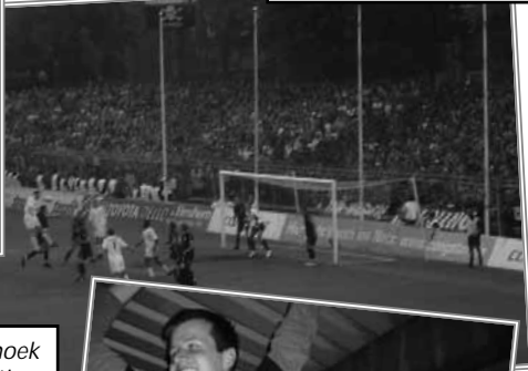
Spelscene - in de hoek de 1.600 luidruchtige Dresdner fans.