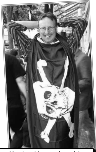
Voorbereiden op de match FC St. Pauli - Dynamo Dresden.