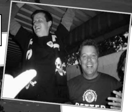
2-2!! FC St. Pauli promoveert naar de 2. Liga!