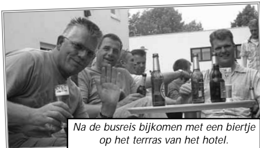
Na de busreis bijkomen met een biertje op het terras van het hotel.