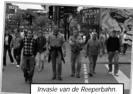
Invasie van de Reeperbahn.