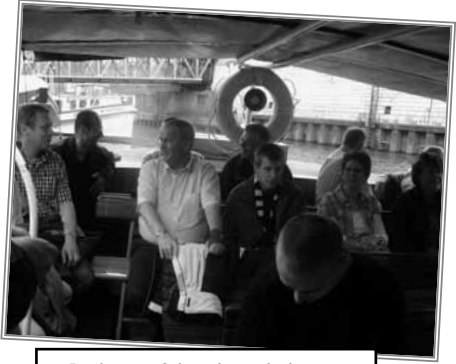
Barkassenfahrt door de haven.