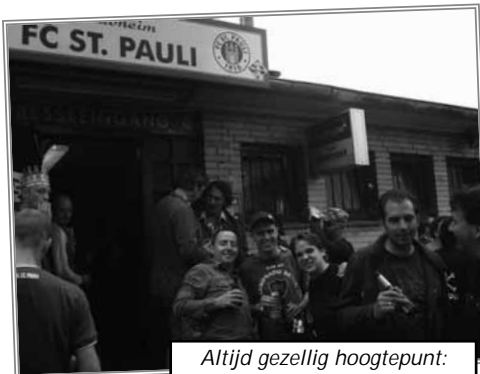
Altijd gezellig hoogtepunt: Clubheim van FC St. Pauli