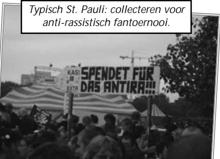
Typisch St. Pauli: collecteren voor anti-rassistisch fantoernooi.