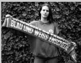
Sjaal Blau u. Weiss Enschede € 9,-