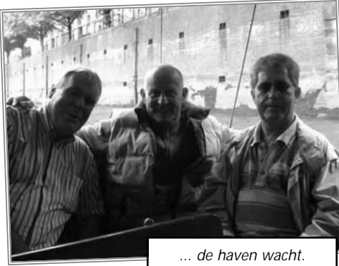
... de haven wacht.