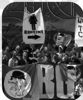
Fraaie banner van de fangroep Bad Gones van Olympique Lyon. Inderdaad, cuisine betekent keuken...

Met de aanmeldingen die via Schalke binnenkomen hoopt FFC Recklinghausen vooral de jeugdopleiding te versterken en te ontwikkelen. De club hoopt op termijn ook met het seniorenteam door te groeien. In de U17 spelen reeds vier jeugdinternationals. Dat team bereikte afgelopen seizoen de eindronde van het Duitse kampioenschap.