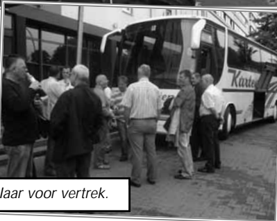
Klaar voor vertrek.