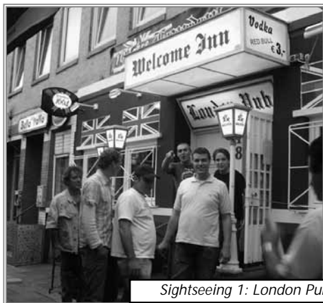
Sightseeing 1: London Pub.