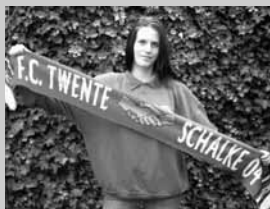
Sjaal Schalke 04 - FC Twente € 9,-