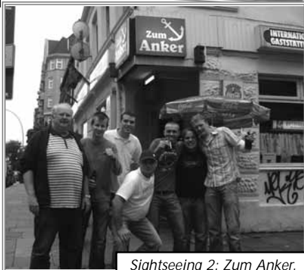
Sightseeing 2: Zum Anker.