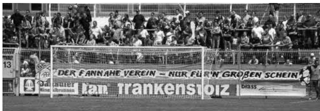
Tijdens het oefenduel bij Viktoria Aschaffenburg is het protestdoek voor het eerst te zien.