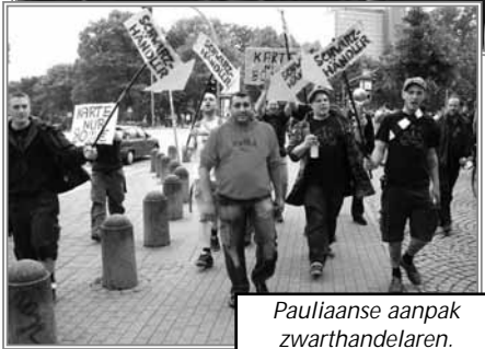
Pauliaanse aanpak zwarthandelaren.