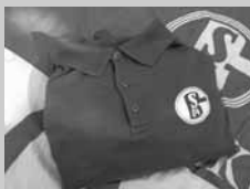
T-shirt: € 7,50 Sweater: € 20,00