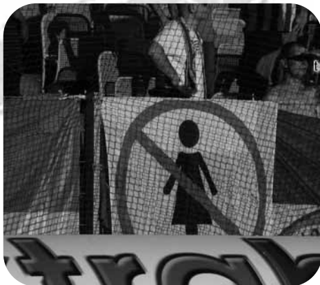
Gezien bij Rapid Wien - Slovan Bratislava: spandoek met een duidelijk statement van de Slovanfans (Intertoto juli 2007)