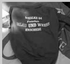
Sweater + t-shirt Blau u. Weiss Enschede 2-zijdig bedrukt zie links. Maten: l, xl, xxl