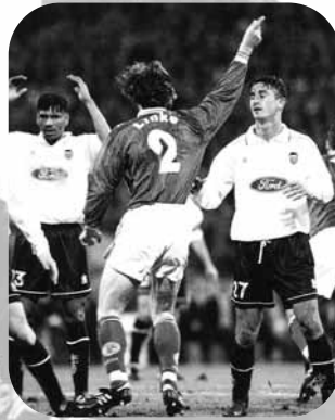
Linkes 1-0 tegen Valencia.