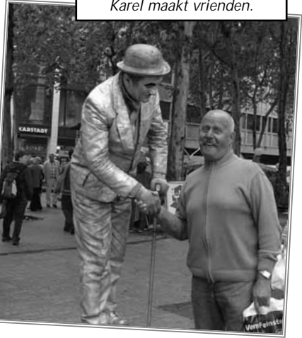
Karel maakt vrienden.