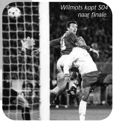
Wilmots kopt S04 naar finale.