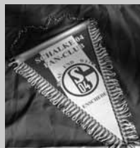
Vaan Blau u. Weiss Enschede € 4,50