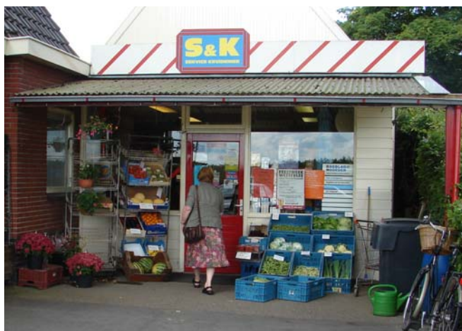
Wij mee om voor een seizoen inkopen te doen.