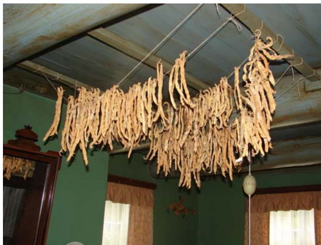
Deze bonen hangen in het museum 't Oale Kompas'

Veel Groningers die 'over ver' zijn gegaan hebben er veel voor over om het weer een keer te eten.