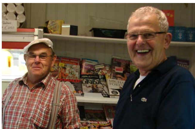
Rechts staat de winkelier en links de teler van de bonen. Ook hier slaat het noodlot toe. Dit was het laatste seizoen dat de bonen verbouwd werden. Er was meer tijd beschikbaar om eens andere dingen te doen en daarom werd het voor de teler moeizamer om de tuin bij te houden.