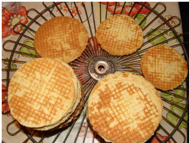
Afkoelen op een rooster geeft een lekker bros wafeltje.