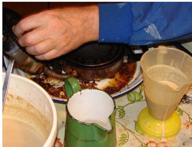
Het oude Grossag ijzer heeft geen anti aanbaklaag en moet af en toe ingevet worden. De moderne ijzers werken veel schoner.