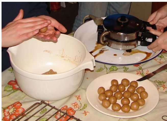
In dit beslag is kaneel als smaakje gebruikt.