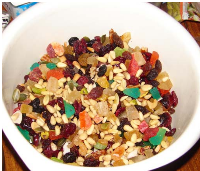
Meng de rest van de vulling ook door elkaar.