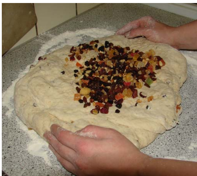
Voeg zoveel bloem toe tot het een soepel en niet plakkend deeg is geworden. Daarna kunnen de vruchtjes er door.