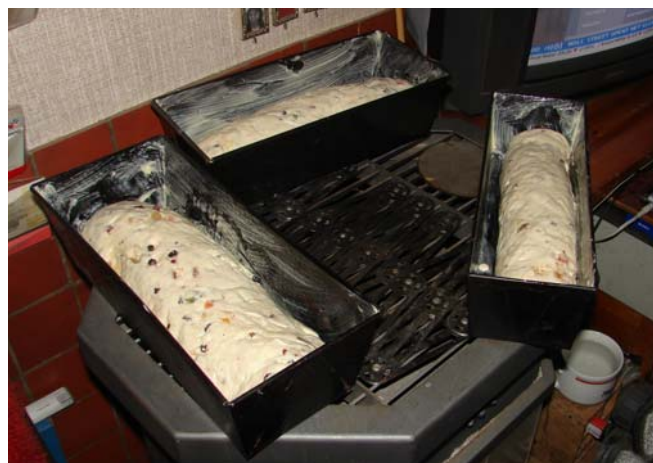
Leg de rollen met de naad naar beneden in de broodvormen, zet ze ca. 3 kwartier te rijzen.