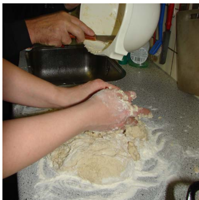
Keer daarna het deeg op een bebloemd werkvlak en kneed nog eens goed door.