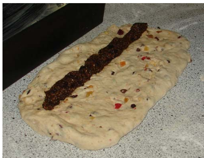
Verdeel het deeg in porties, druk deze plat uit. Leg midden op een rol van de "spijs", klap het deeg er over en druk de naad dicht.