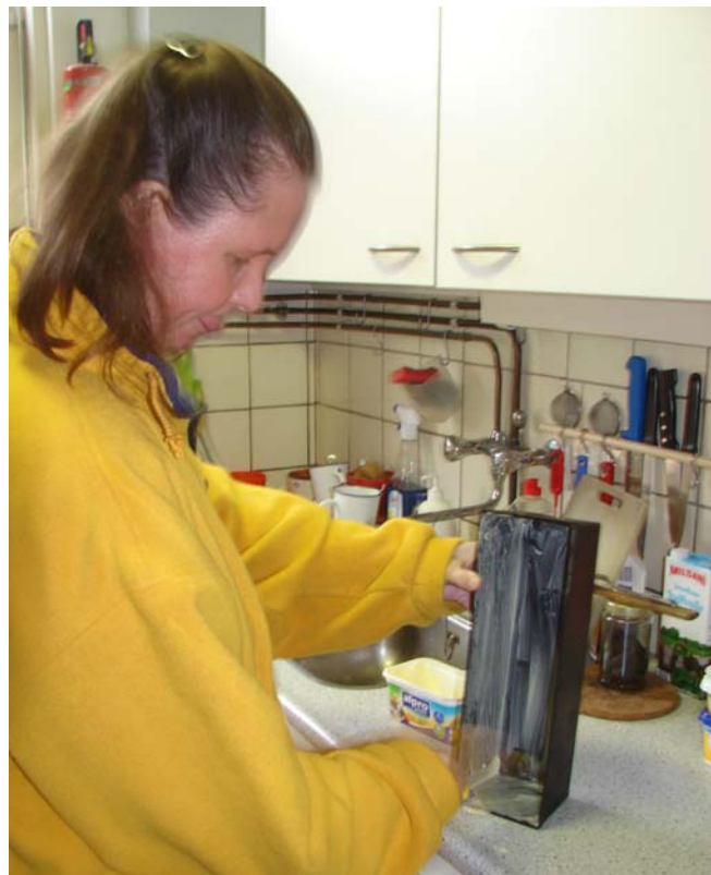
Beboter de broodvormen.