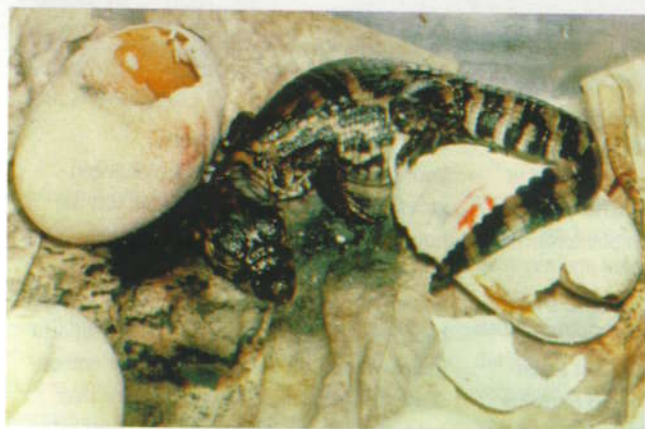
Babykrokodillen roepen vanuit het ei wanneer het tijd voor ze wordt om uit het ei te kruipen, waarop moeder de baby's gaat bevrijden. De meeste aanvallen van krokodillen op mensen is wanneer ze te dicht in de buurt komen van krokodillennesten. De krokodillenmoeder is een furie als het om haar jongen gaat.