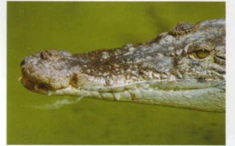
De kop van een pantserkrokodil.