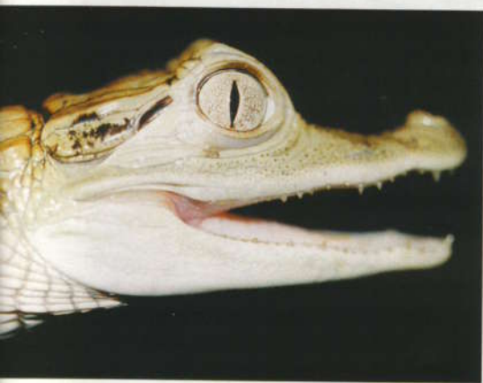
De brilkaaiman, Caiman crocodilus , komt onder meer in de Amazonerivier en Midden-Amerika voor.

Adres: Bellamyplein 35, 4381 CH Vlissingen, tel.: 0118 - 417219 Buslijn 56 en 104. 20 min. lopen vanaf NS-station Vlissingen. Stichting Iguana is ook te vinden op internet: http://leden.tref.nl/iguana/