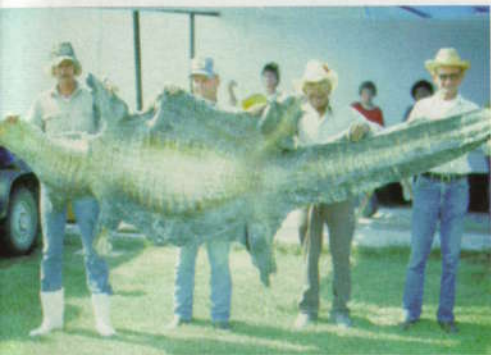
Jagers die de huid van een Mississippi-alligator omhoog houden.