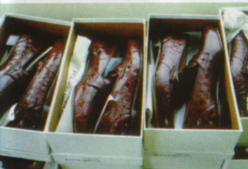
Voor schoenen van 'krokodillenleer' worden meestal de huiden van verschillende soorten Zuid-Amerikaanse kaaimannen gebruikt. De huid is veel goedkoper dan krokodillenhuid of alligatorhuid en er is veel makkelijker aan te komen. De consument ziet vaak het verschil niet en betaald een veel te hoge prijs voor producten van kaaimanhuid. Colombia is het de grootste producent van kaaimanhuid voor de wereldmarkt.