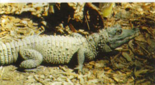
De West-Afrikaanse dwergkrokodil, Osteoleamus tetraspis , is de kleinste van de echte krokodillen. Net als de dwergkaaiman wordt hij gegeten door de lokale bevolking en gebruikt voor het fabriceren van curiosia. Er worden ook tienduizenden van deze dieren geëxporteerd als goedkope, 'echt Afrikaanse, met de hand gemaakte' handtassen, vaak monsterlijk uitgerust met een deel van het hoofd van het dier op de klep van de tas. Deze tassen worden uiteraard ook verkocht op straat in Afrika, aan toeristen en in 'culture shops' voor een habbekrats. Foto: Peter Brazaitis

De dwergkaaiman, Paleosuchus palpebrosus , bewoont de tropische poelen, stromen en waterwegen van het Amazone-gebied in Zuid-Amerika. Op deze kleine soort wordt niet gejaagd vanwege zijn huid want vlak onder die huid zitten allerlei harde botplaten die het moeilijk maken te huid te verwerken. Het dier wordt gegeten door de lokale bevolking en dient als voedsel voor de gemigreerde goudzoekers. Er wordt op hem gejaagd om hem opgezet te kunnen verkopen als curiositeit aan toeristen en te exporteren. Foto: Peter Brazaitis