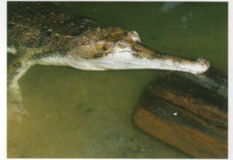
Een valse gaviaal, Tomistoma schlegelii (Schlegel's Gaviaal).