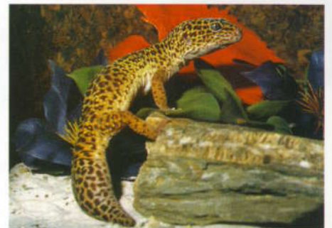
Allerlei soorten reptielenhuiden worden verhandeld. Boven: een luipaard gekko, Eublepharis macularius . Onder: een maisslang, Elaphe guttata .

werd op Schiphol een partij krokodillen en land- en waterschildpadden in beslag genomen door de Algemene Inspectie Dienst (AID). Een probleem is dat reptielen geen geluid maken en daardoor niet snel opvallen bij controleurs. En dat terwijl de dieren vaak zodanig zijn verpakt dat verminking geen uitzondering is. Van de dieren die levend worden getranspor-