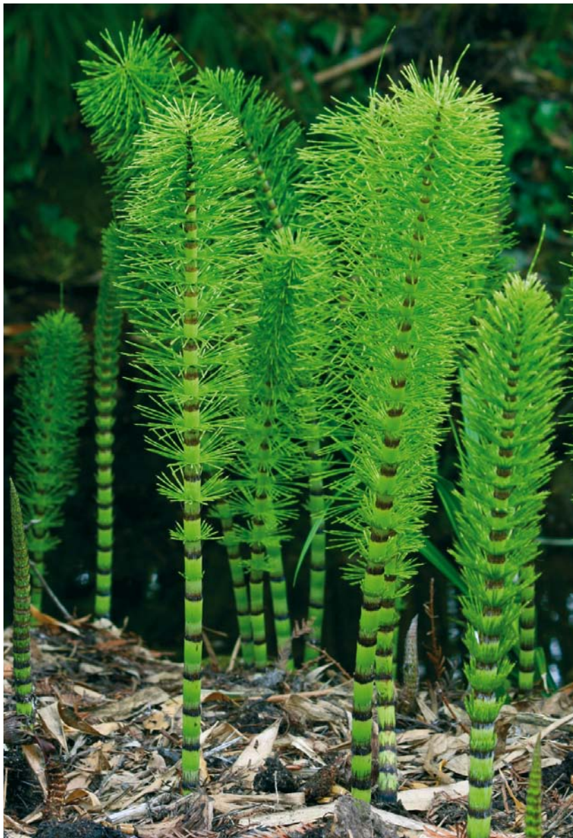
AFBEELDING 2. | Equisetum is het enige nog levende genus van de familie Equisetaceae. Hier een voorbeeld: Equisetum telmateia uit Engeland.

Het plantenfossiel van deze studie is gevonden in schalies in de opgevulde subrosiepijp (het zinkgat) in het midden van groeve III van het groevecomplex. Deze schalies zijn daar nu niet meer aanwezig, maar schalies van vergelijkbare ouderdom zijn nog wel zichtbaar in groeve IV. De ouderdom van beide schalies is Rhaetien (Boven-Trias) zoals bleek uit eerder onderzoek aan tweekleppigen,