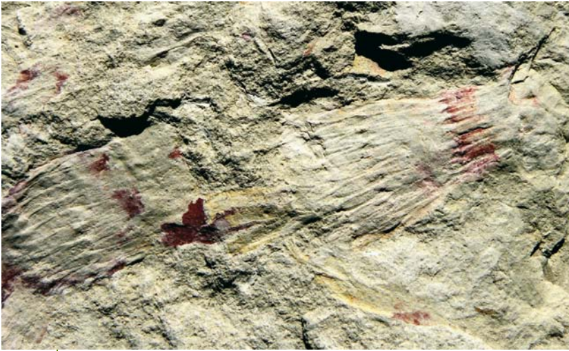
AFBEELDING 5. | Equisetites muensteri uit de Onder-Jura van Bayreuth in Duitsland. Breedte van de foto 7 cm.