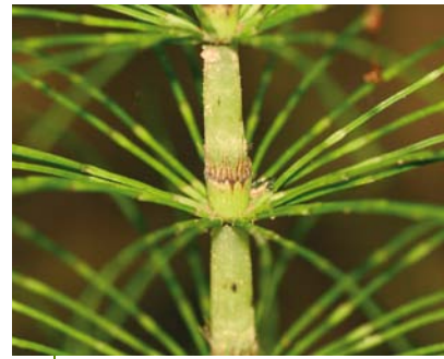
AFBEELDING 3. | Equisetum telmateia laat hier duidelijk de lijn-vormige bladeren zien die in kransen op de knopen staan.

pollen en sporen. De sedimenten behoren toe aan de Sleen Formatie.